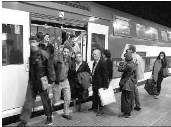
Els trens de Rodalies funcionaran fins a les dotze

El principal problema és la xarxa de metro, ja que TMB al·lega que el retard en el canvi de la catenària de dues línies, treball que executa la Generalitat, podria posar en perill els terminis previstos i fer que no es pogués allargar l'horari fins l'any que ve.